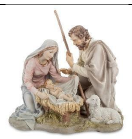
Б) Рождество Христово